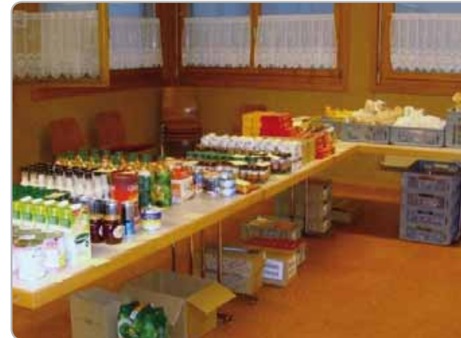
Reichhaltiges Angebot an der neuen Abgabestelle in Langnau.

Während der Zeit vom 24. Dezember 2009 bis 3. Januar 2010 finden keine Lebensmittelverteilungen statt. Ab dem 4. Januar 2010 werden die Abgabestellen wieder bedient.