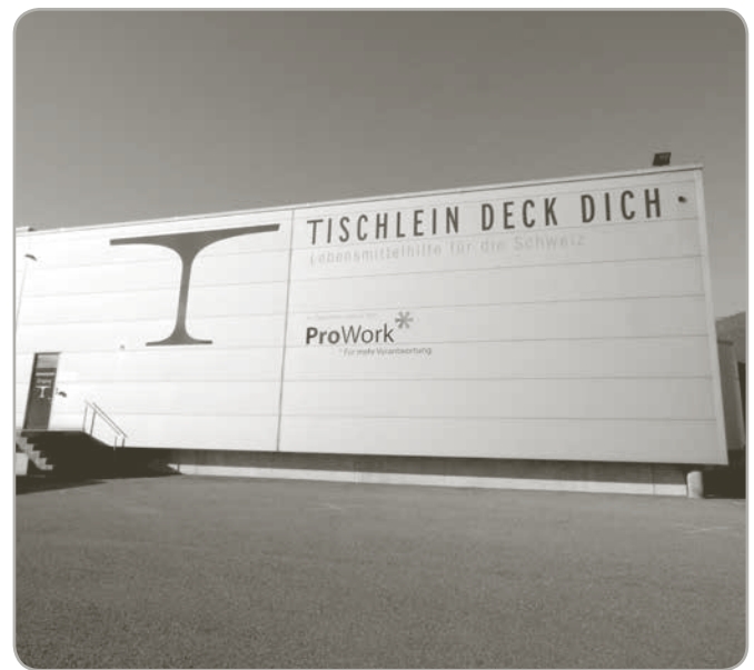
La facciata della nuova Piattaforma di Grenchen con la nostra insegna.

Il contratto di cooperazione con Pro Work è stato sottoscritto. Abbiamo anche trovato un Responsabile che dirigerà la nostra nuova Piattaforma a Grenchen al 50%. Da novembre fino a metà dicembre si sono svolti i lavori di ristrutturazione dell'attuale magazzino. Un aspetto particolarmente positivo: Transgourmet ha donato la cella congelazione, installata sul posto con 50 posti per le palette.