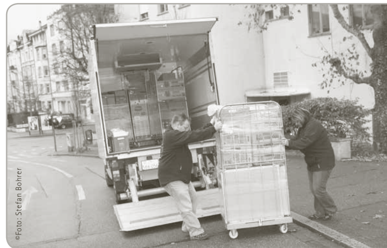
Gli autisti di Kiebitz aiutano a scaricare i carrelli consegnati.