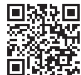
Table couvre-toi est parrainée par:

L'histoire de Table couvre-toi est sur PLANETHOMY: