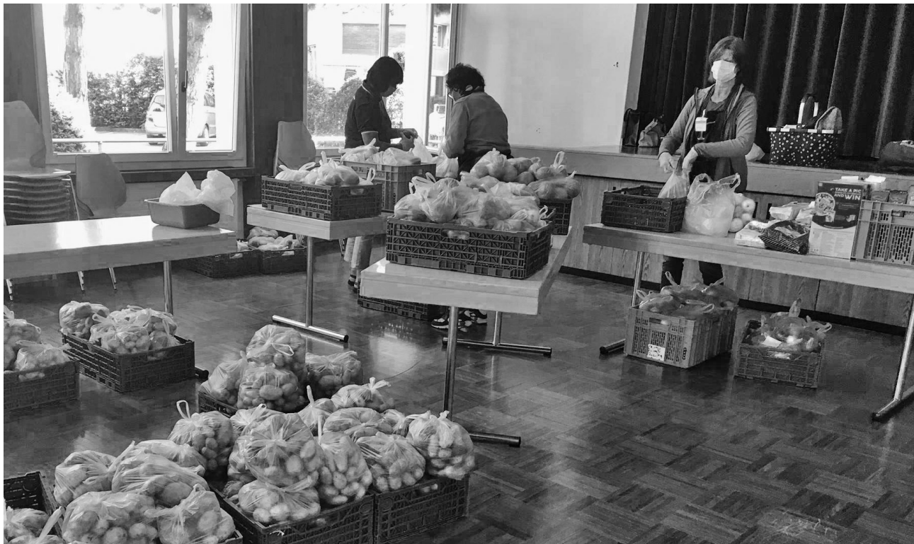
Les denrées alimentaires ont été emballées dans des sacs pour les bénéficiaires du centre de distribution de Comander.