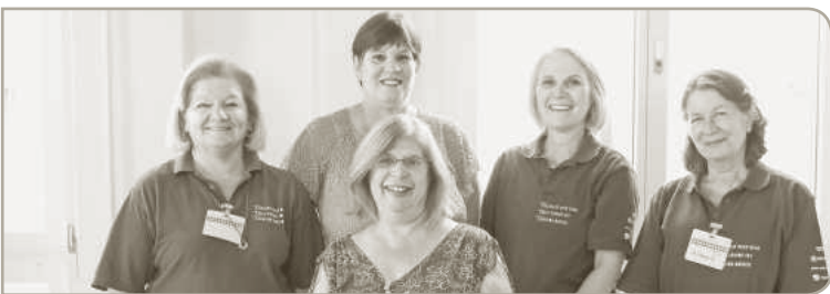
Les « American Women of Zurich » soutiennent Table couvre-toi financièrement et concrètement !