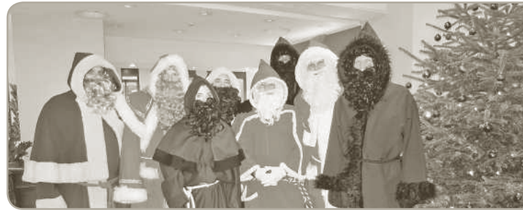
Les Saint-Nicolas et Pères Fouettards du Lions Club Winterthur-Altstadt en route au profit de Table couvre-toi .