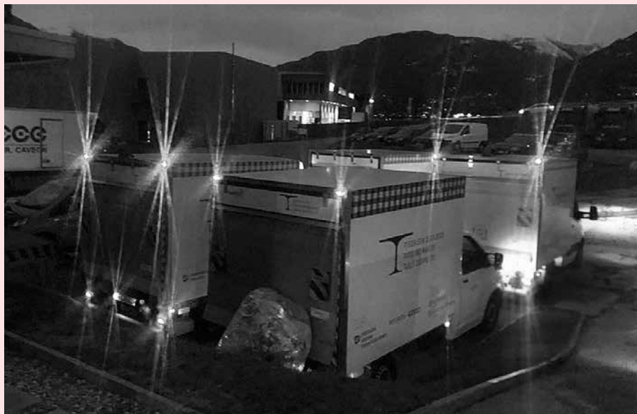
Alle 7.30 i camion partono dalle piattaforme di Cadenazzo.

diverse volte in altri supermercati. Verso le 10.30 torniamo a Cadenazzo. Tutto il cibo viene pesato: sono 520 chili di cibo fresco. Viene controllato e suddiviso velocemente, a dipendenza della scadenza, nelle celle frigo. Tutto deve funzionare come un orologio svizzero, per non sballare i gradi e mantenere la catena del freddo. Anche gli altri camion stanno arrivando. Gli autisti non guidano quasi mai più di tre ore di seguito, fanno regolari pause e tutte le norme sono rispettate.