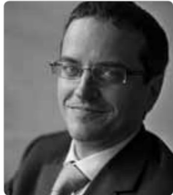
Prof. Guido Palazzo

Die Produktion und der Konsum von Gütern und Dienstleistungen sind unvermeidbar mit sozialen und ökologischen Auswirkungen gekoppelt. Die Erde heizt sich auf, Wasserressourcen werden verschwendet und vergiftet, die Ozeane werden mit Plastik zugemüllt, Biodiversität wird zerstört und Menschenrechte werden mit Füßen getreten. Die Sensibilität für derartige Probleme wächst in der Gesellschaft: bei den Konsumenten, den Investoren, den politischen Entscheidungsträgern und auch in den Unternehmen selbst.