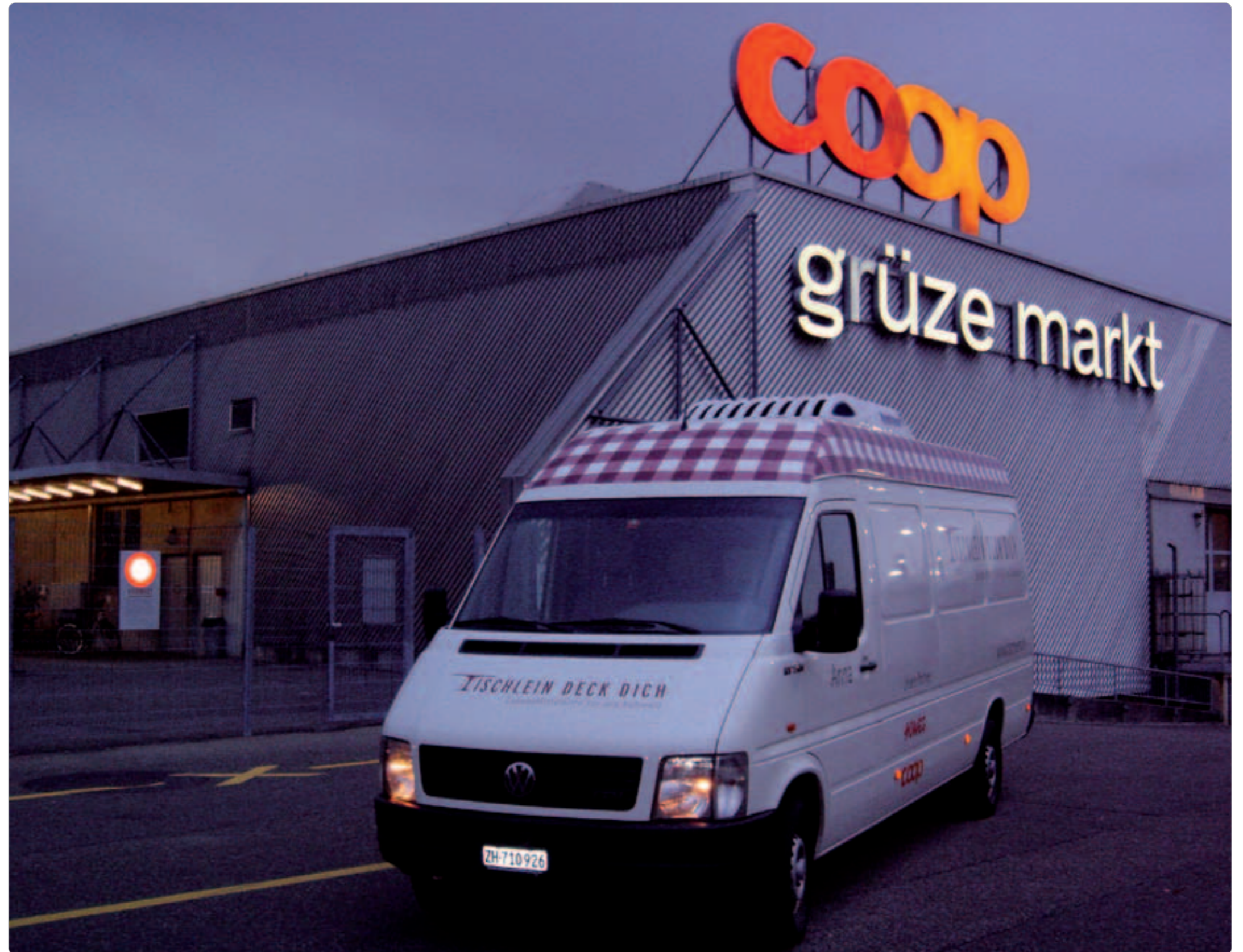
Das Fahrzeug «Anna» ist seit November in der Zentralschweiz unterwegs.