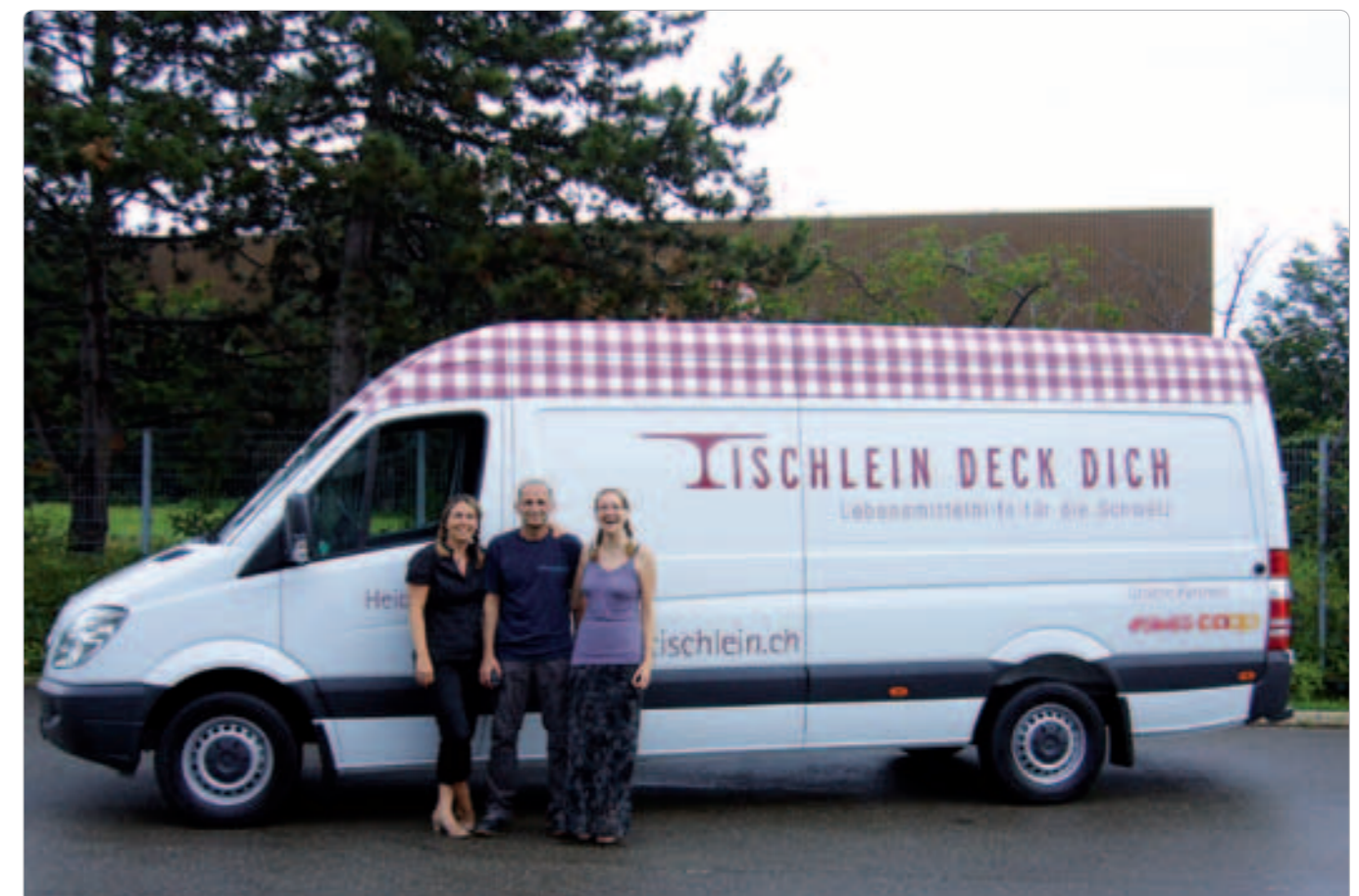
Das Fahrzeug «Heidi» unterwegs in Graubünden.