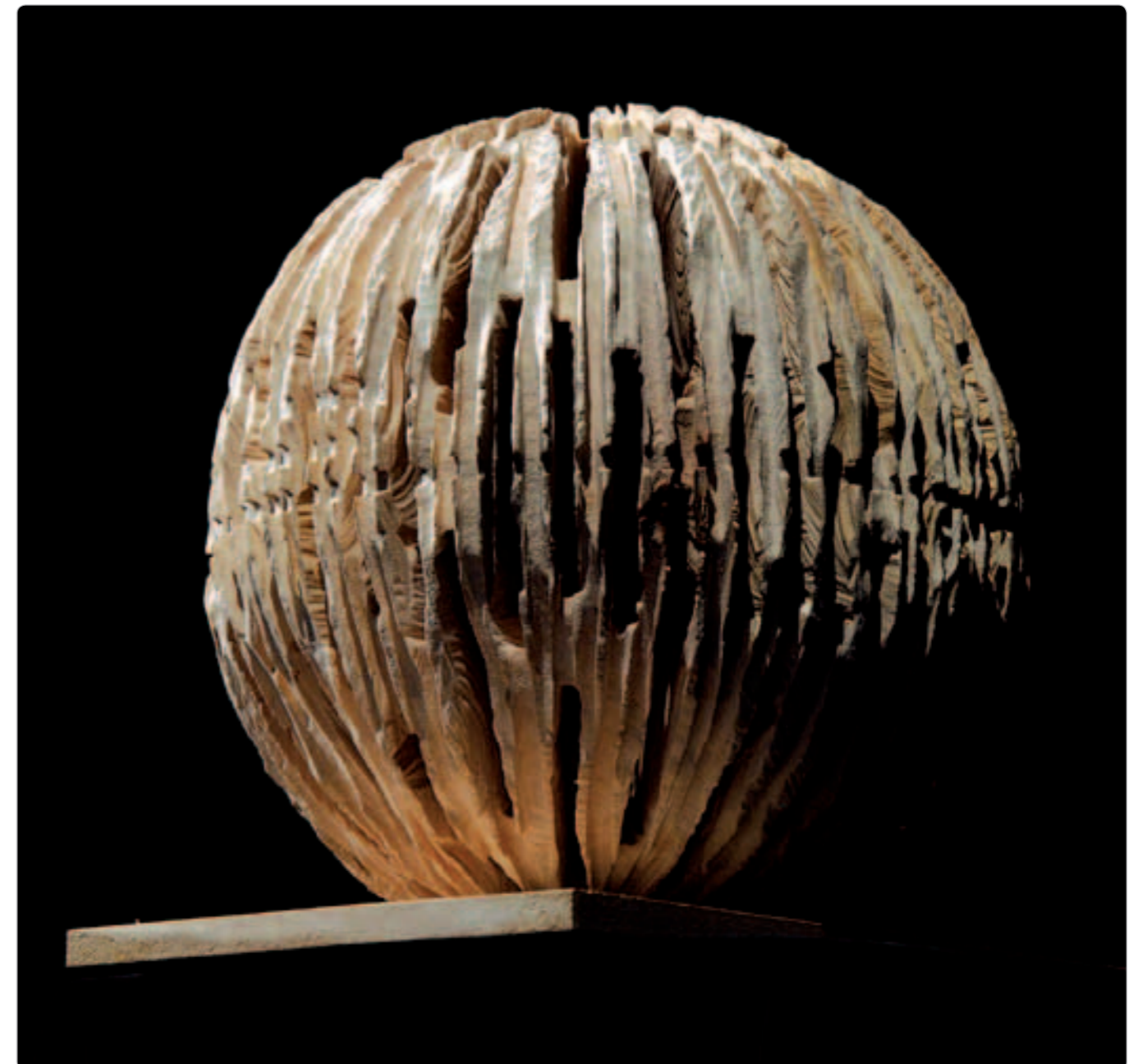
Prix Evenir: Preisskulptur aus Holz