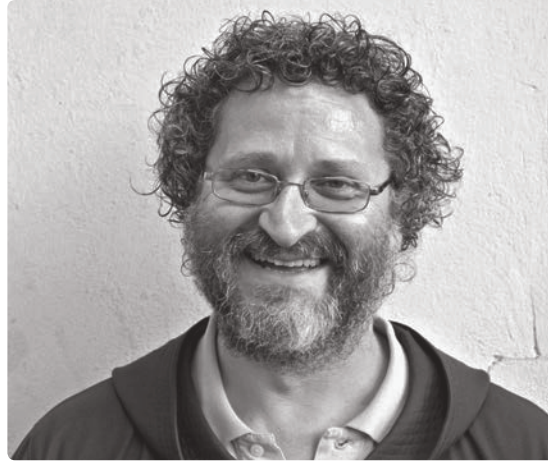
fraMartino desidera concentrarsi su altri progetti sociali in Ticino.

Quest'anno ricordiamo i dieci anni di distribuzione alimentare in Ticino. Il sostegno alimentare s'è rivelato un importante bisogno anche nella Svizzera italiana, come conferma il rapido sviluppo della nostra Associazione. Dal luglio 2010, Tavolino Magico è parte integrante dell'ente « Tischlein deck dich ». Negli ultimi quattro anni, la crescita di Tavolino Magico è stata caratterizzata da un'ulteriore professionalizzazione e dall'aumento del personale impiegato, per garantirne pure il miglioramento qualitativo. Dopo una fase di consolidamento, Tavolino Magico gode oggi di solide basi ed è nelle condizioni di assumere al meglio i propri diversi compiti dalla Piattaforma regionale di Cadenazzo, da poco ristrutturata. In questo modo, è in grado di distribuire una maggiore quantità di generi alimentari alle persone bisognose. Ringraziamo sentitamente tutti i volontari, i collaboratori, i fornitori di merce, i donatori e gli amici di Tavolino Magico , che ci stanno accanto con generosità nel nostro cammino e contribuiscono a scrivere con noi una storia vincente.