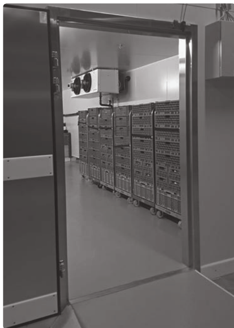
Vue d'une cellule frigorifique de la plateforme orientale.

La coopération avec Table Suisse nous a permis, en 2015, de récupérer une quantité beaucoup plus importante de denrées alimentaires, notamment la part de fruits et légumes qui a progressé d'environ 40%. Grâce aux travaux d'agrandissement de la plateforme de Winterthour, la capacité de stockage des produits surgelés atteint désormais 90 m 2 (contre 8 m 2 auparavant), et celle des cellules frigorifiques est passée