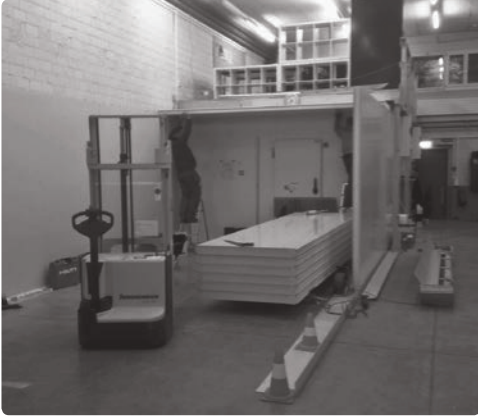
Au beau milieu des travaux d'agrandissements de la plateforme Suisse centrale.

Aussi soulage-t-elle les deux plateformes interrégionales tout en tirant parti, pour les transports, de son implantation géographique. Elle peut approvisionner des centres de distribution sans avoir à passer par l'A1 surchargée, ni par le tunnel de Gubrist.