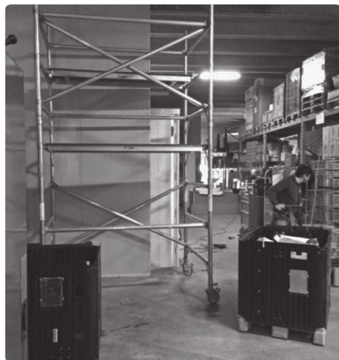
L'extension de la plateforme de Cadenazzo prend forme.