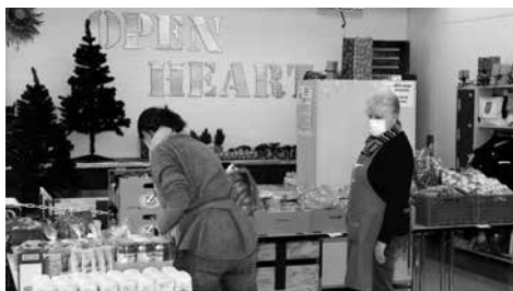
Pour la toute dernière fois, les bénévoles préparent les tables en vue de la distribution à l'ancien Open Heart.

L'Open Heart de Zurich a été le premier centre de distribution de Table couvre-toi . Maintenant, il appartient au passé. Mais il a déjà pris un nouveau départ à la Zentralwäscherei de Zurich.