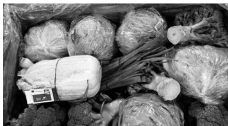
Des denrées alimentaires d'une qualité irréprochable soustraites à la destruction.